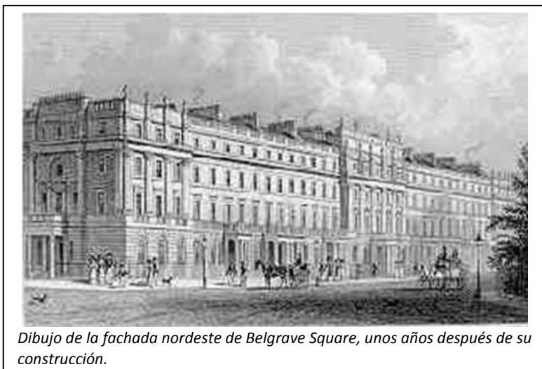
Dibujo de la fachada nordeste de Belgrave Square, unos años después de su construcción.

El plan original consistía en cuatro grupos de casas aterrazadas, diseñadas por George Basevi, cada uno comprendiendo once grandes casas blancas estucadas; tres mansiones independientes en las esquinas, con un diseño particular, y en el medio, una de las plazas más grandes e imponentes del siglo XIX. La numeración de las casas fue hecha en sentido contrario a las agujas del reloj, comenzando por el norte. Para el año 1840 la mayoría de las casas ya estaban construidas y ocupadas.