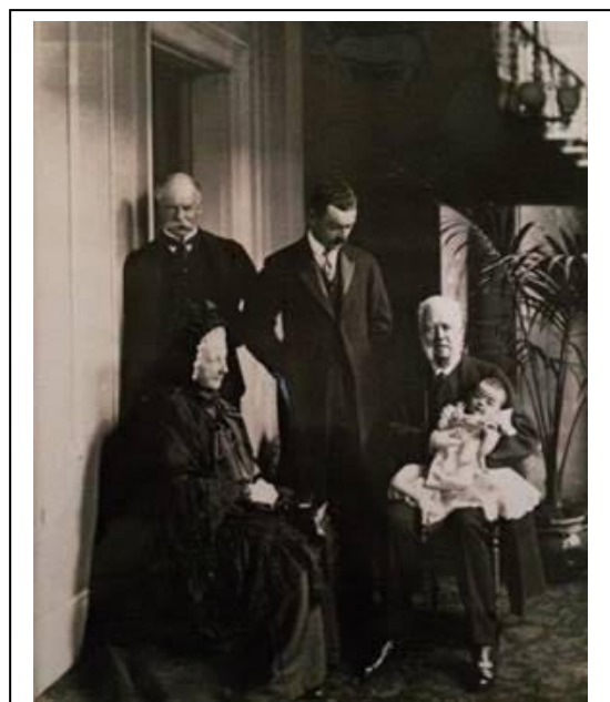
Foto sacada el 7 de julio de 1899 en 49 Belgrave Square. De izquierda a derecha: el séptimo Duke of Richmond (Charles Gordon-Lennox), el octavo Duke of Richmond (Charles-Henry Gordon-Lennox) también conocido como Lord Settrington. Sentados: Lady Sophia Cecil y el sexto Duke of Richmond, con el hijo de Lord Settrington en sus brazos.

El 6º Duke of Richmond se casó con Frances Harriett Greville, hija de Algernon Greville, en 1843. Tuvieron seis hijos, entre ellos su hijo primogénito, Charles Gordon-Lennox, 7º Duke of Richmond (1845–1928).