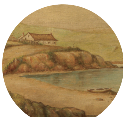
Islas Malvinas. Acuarela (detalle). 1829.

Ninguno, desde el punto de vista del derecho internacional. Un referéndum entre los habitantes de las islas en nada altera la esencia de la Cuestión de las Islas Malvinas y su previsible resultado no pone fin a la disputa de soberanía, ni a los incuestionables derechos argentinos.