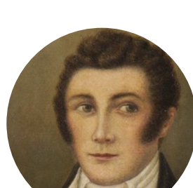
Retrato de Luis María Vernet. Gobernador argentino de las Islas Malvinas.

¿Por qué el interés británico en las Malvinas?